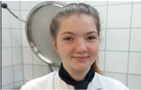
10 Herzliche Gratulation!